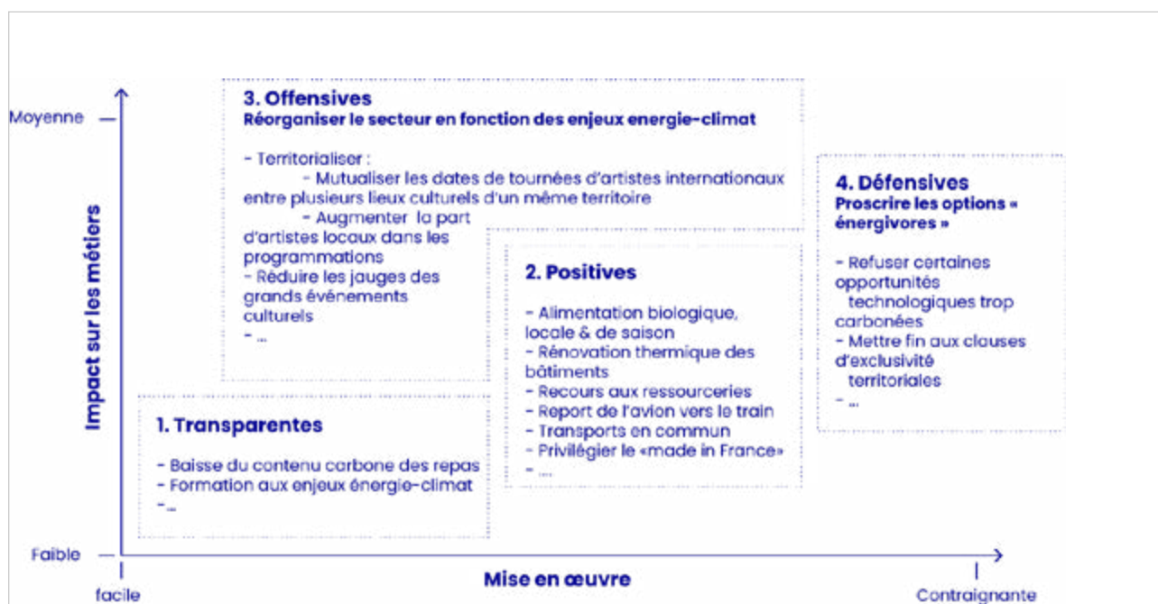
Figure : Tableau des typologies de mesures – source : The Shift Project

Les mesures « défensives ». Elles consistent à proscrire les options « énergivores » – recours à de gros groupes électrogènes, rediffusion systématique en streaming à haut débit, tournées effrénées – afin de permettre l'émergence d'options alternatives plus raisonnables.